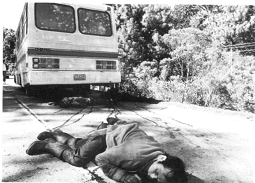
Zapatistas que viajaban en un bus en las cercanías del Cuartel General de la 31 Zona Militar

De todas formas, la misión recibió seguridades por parte de las autoridades de la Comisión Nacional de Derechos Humanos de que se estaba llevando a cabo una investigación para determinar las circunstancias de cada una de las muertes citadas; radicando la principal dificultad en que el Ejército no ha informado dónde fueron sepultados los cadáveres en cuestión, por lo que no había sido posible la realización de las necropsias correspondientes.