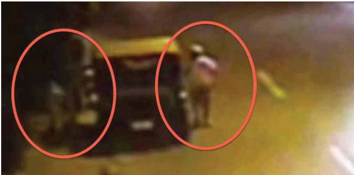
ກ້ອງວົງຈອນປິດ: ທ່ານ ສົມບັດ ສົມພອນ ພ້ອມດ້ວຍລົດຂອງທ່ານຢູ່ທີ່ປ້ອມຕຳຫຼວດ

ມາຮອດປະຈຸບັນພາບບັນທຶກໃນກ້ອງວົງຈອນປິດໄດ້ກາຍເປັນເຄື່ອງມືທີ່ສຳຄັນທີ່ຈະສະແດງໃຫ້ເຫັນສິ່ງທີ່ເກີດຂຶ້ນໃນວັນທີ 15 ທັນວາ 2012