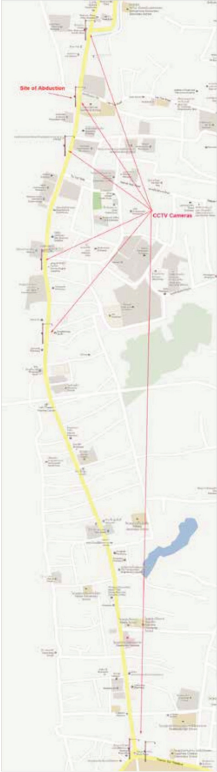
ສະຖານທີ່ທີ່ອາດຈະມີກ້ອງວົງຈອນປິດຕິດຕັ້ງໃກ້ກັບປ້ອມຕໍາຫລວດ

ມາຮອດປະຈຸບັນທາງການລາວຄວນຈະໄດ້ຮວບຮວມຂໍ້ມູນທັງໝົດໃນກ້ອງວົງຈອນປິດ, ສ້າງເປັນເອກະສານ, ເຜີຍແຜ່ ແລະ ກວດສອບ ຢ່າງເປັນລະບົບເພື່ອຄົ້ນຫາຫຼັກຖານໂດຍສະເພາະແມ່ນພະຫານະທີ່ກ່ຽວຂ້ອງ, ສີຂອງລົດຄັນດັ່ງກ່າວ, ແລະ ປ້າຍທະບຽນລົດນັ້ນແມ່ນຫຍັງ ແລະ ເຮັດຢູ່ໃສເພື່ອຈະຈັດວາງລໍາດັບຂອງເຫດການທີ່ເກີດຂຶ້ນໄດ້.